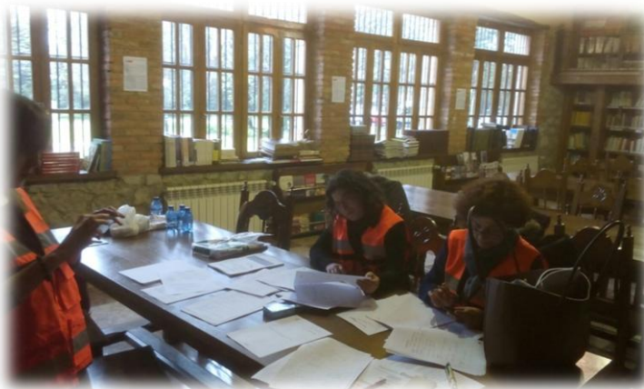
Trabajadoras Sociales trabajando en las incidencias que surgen durante el simulacro de emergencia. Simulacro CANTABRIA 2017.

Una vez realizadas las primeras actuaciones llevadas a cabo en este caso por la UME, con las que se trata de poner a salvo a las personas, toman protagonismo las necesidades sociales : reunificaciones familiares, necesidad de alojamiento, prestaciones básicas, trámites burocráticos que los afectados