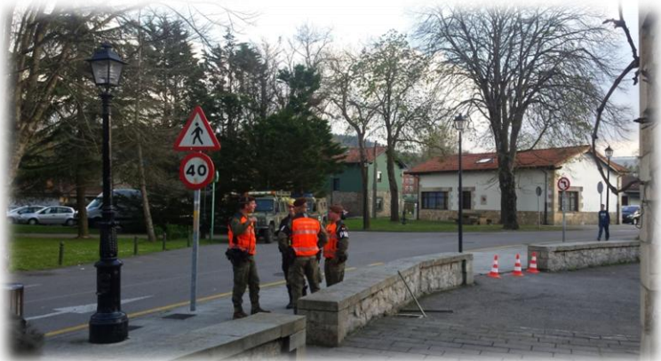
Militares de la UME en Puente San Miguel (Reocín) donde se realizó el simulacro de emergencia. Simulacro CANTABRIA 2017.

En esta ocasión contamos con dos escenarios de actuación, uno en Madrid en el Puesto de Mando Central y otro en Puente San Miguel - Reocín. En este último es en el que me encontraba ubicada, en el cual se instaló un Dispositivo Psicológico y Social de ayuda a damnificados y la Morgue.