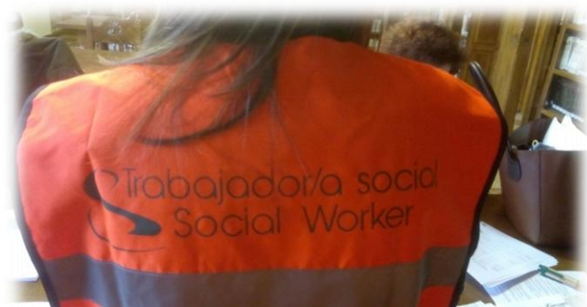
Visibilidad de las/os Trabajadoras/es Sociales en las situaciones de emergencia. Simulacro CANTABRIA 2017.

nuestro día a día profesional trabajamos habitualmente con emergencias individuales o familiares.