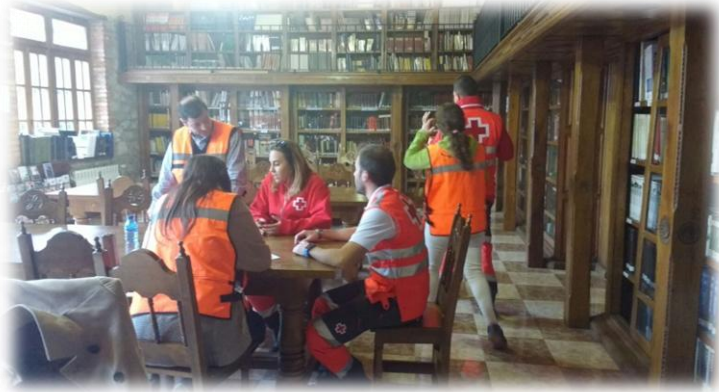
Personas del equipo del Simulacro de Emergencias de Cantabria 2017. Simulacro CANTABRIA 2017.

En el Simulacro Cantabria 2017, al igual que en simulacros anteriores, se contó con figurantes, miembros del ejército y en alguna ocasión, por iniciativa de una compañera y en vista de la baja intensidad que hubo en algunos turnos, miembros de Cruz Roja y algún vecino de la localidad.