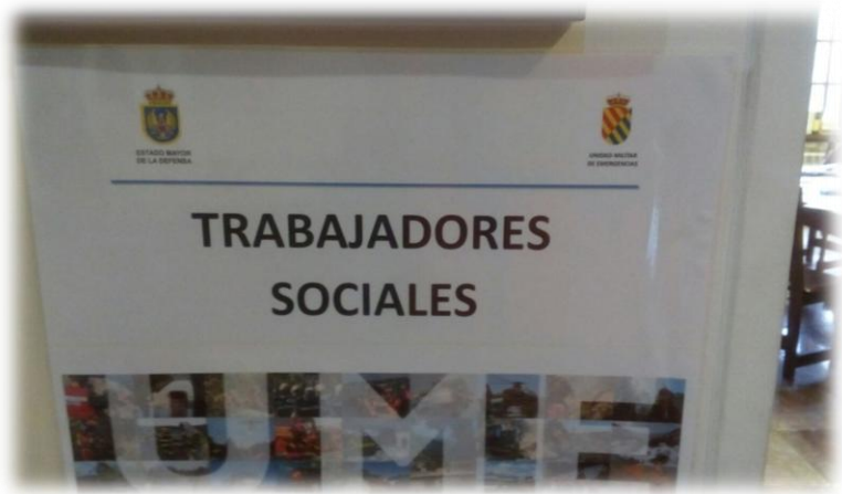
Espacio reservado para las/os Trabajadoras/es Sociales en las situaciones de emergencia. Simulacro CANTABRIA 2017.

estrés y es necesaria una profunda interiorización de nuestros conocimientos para poder actuar de una forma efectiva y eficaz. Eso podemos conseguirlo a través de una participación activa en los simulacros organizados por la UME y Protección Civil. Desde mi punto de vista sería importantísima la creación de un equipo de trabajadoras/es sociales de intervención en emergencias , con profesionales preparadas/os y dispuestas/os a trabajar en estas situaciones, que como anteriormente mencionaba, estén integradas/os en los Planes Territoriales y que también den a conocer nuestro trabajo en este ámbito. Sigue siendo muy importante