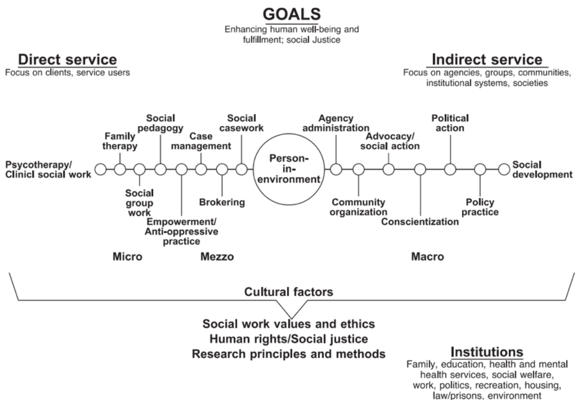
Ilustración 1. Niveles y elementos que definen el Trabajo Social

Esta definición hace especial referencia al compromiso del Trabajo Social con los DDHH y la justicia social como el camino correcto para la intervención profesional (Hare, 2004; Healy, 2008; Lima, 2016). Sobre esta base, Hare (2004, p. 412) elabora una propuesta que recoge los principales ejes que definen el Trabajo Social a partir de tres niveles de intervención profesional: micro, meso y macro (ilustración 1). Como reconoce la misma autora, son visibles importantes variaciones en la práctica del Trabajo Social, por lo que el elemento determinante y aglutinador para definir la práctica de esta profesión es atender a la persona en interacción con su entorno físico y social. Reconociendo este hecho, la práctica profesional puede desarrollarse tanto en el ámbito público como en el privado.