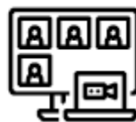
VIDEOCONFERENCIAS (5 X 3 HORAS)