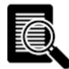
CASO PRÁCTICO (10 HORAS)

TEÓRICO-PRÁCTICA: De las 50 horas totales del curso, 25 se computan como teóricas con la lectura y comprensión de los textos de cada módulo, 15 son horas prácticas distribuidas en 5 videoconferencias de 3 horas cada una y las 10 horas restantes se reservan para el caso práctico final y su corrección con feedback personalizado.