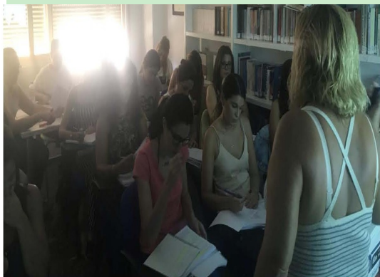
Asistentes al curso

Ésta formación se impartió a 32 Trabajadoras/es Sociales, dando respuesta a las necesidades de formación planteadas por el colectivo colegial para afrontar las pruebas de oposiciones, siendo ésta la segunda vez que se organiza este curso durante el año 2018.